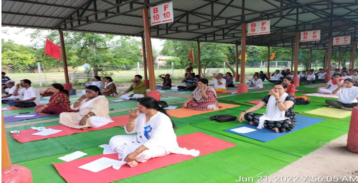
Jun 21, 2022 7:56:05 AM

Principal Govt. Bilasa Girls P.G. College (Autonomous) Bilaspur (C.G.)