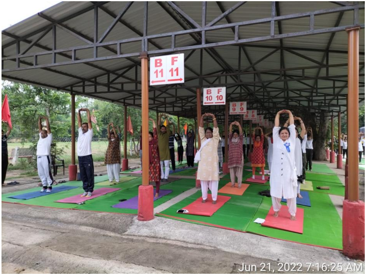
Jun 21, 2022 7:16:25 AM